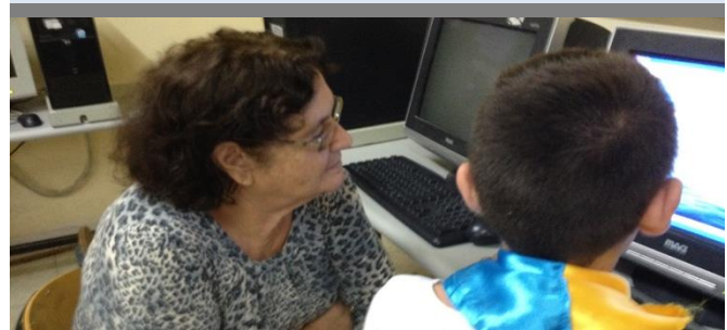
בתמונה: בי"ס רבין, נשר

פנו אלינו בכל שאלה בנוגע להעלאת הסיפורים או לכל נושא אחר.